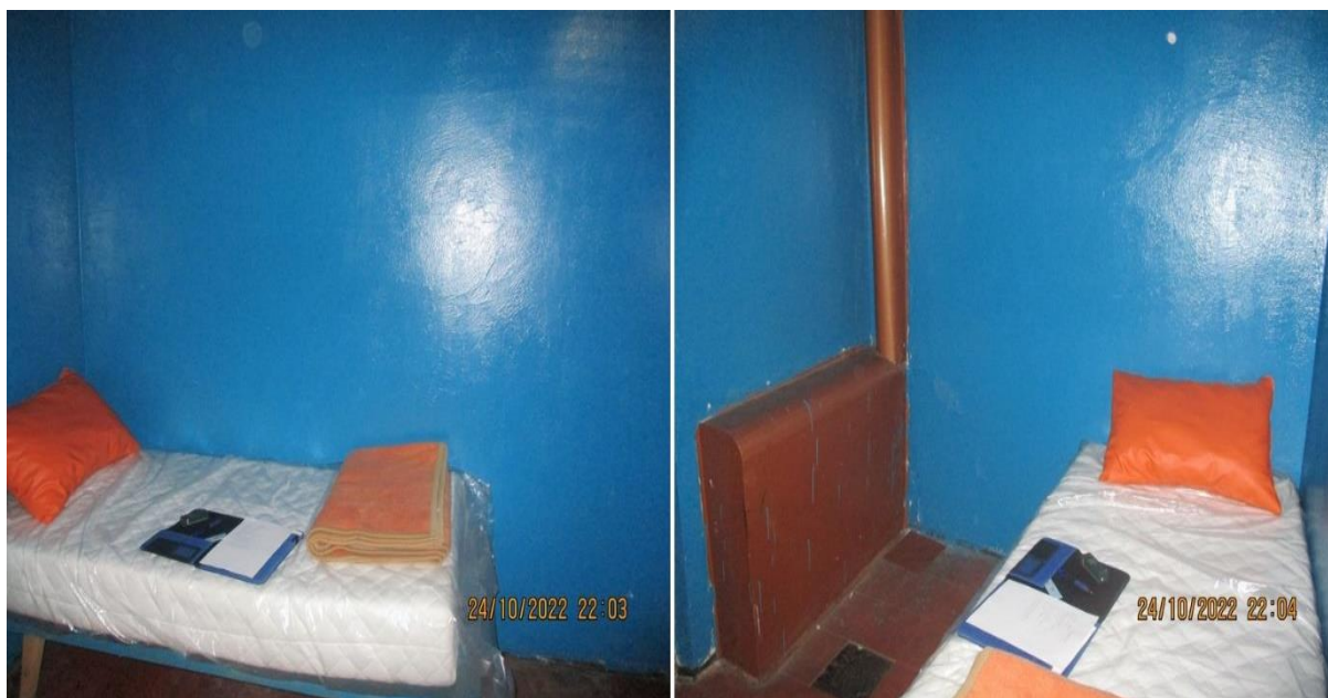
просторије за задржавање ПС Димитровград

Ове просторије се користе за задржавање лица у складу са правилима о безбедности саобраћаја на путевима, односно највише до 12 сати. Лица се периодично тестирају на присуство алкохола, према утврђеној табели и пуштају на слободу када ниво алкохола падне на довољан ниво. Од почетка године, било је задржано 20 лица у овим просторијама. У случају задржавања у прекршајном поступку која могу трајати до 24 сата лица се воде у седиште ПУ Пирот, у којој се налазе нове, реновиране просторије, а у случају задржавања у кривичном поступку у Одељење притвора КПЗ Ниш. 17