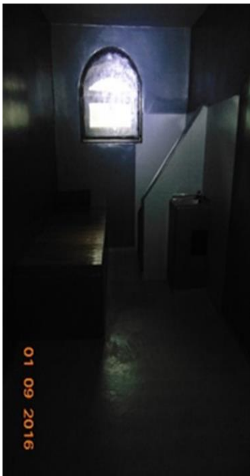
просторија за задржавање – посета НПМ обављена 2016. год.

Доток природне светлости, за који је НПМ приликом претходне посете утврдио да је неадекватан, није могао бити проверен јер је посета обављена ноћу, али делује да ништа није предузето у том погледу. У одговору ПУ Нови Пазар на препоруку да предузме мере како би се у просторији за задржавање у ПС Сјеница побољшао доток природне светлости, коју је НПМ тада упутио, наведено је да су наложене мере да се поступи по препоруци. 10