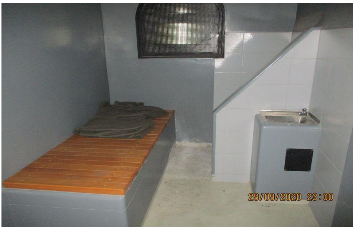
просторија за задржавање

ПС Сјеница ће обезбедити комплетну опрему за лежај у просторији за задржавање (душек, јастук, јастучницу, чаршав, ћебад и навлака за ћебе) и исту ће одржавати чистом.