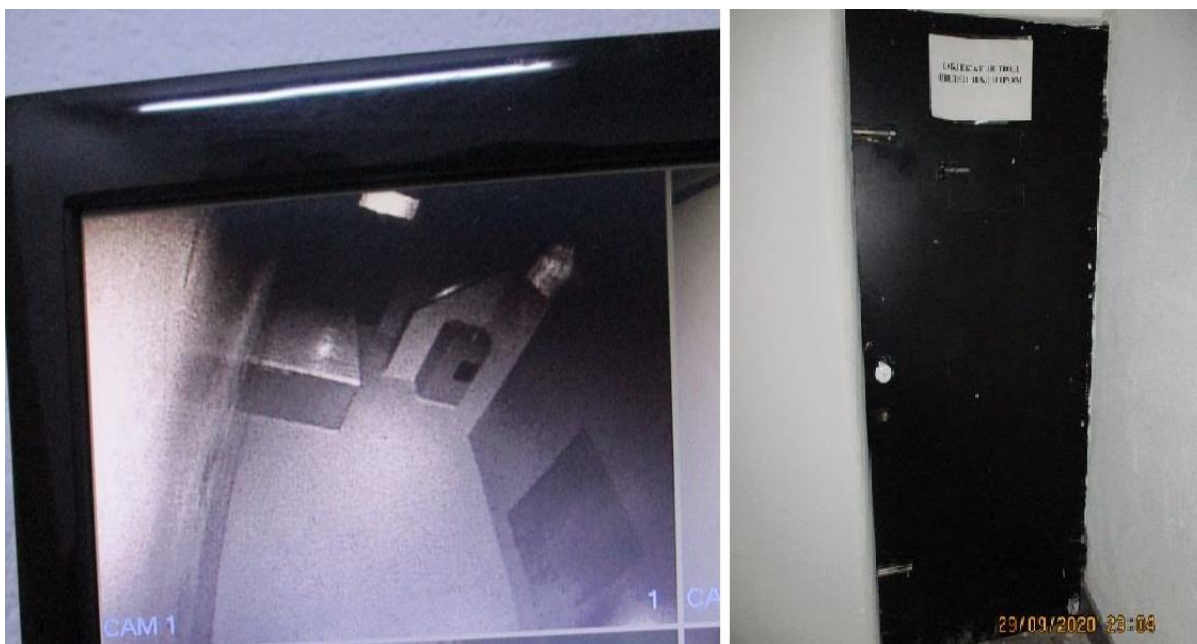
видео надзор над просторијом за задржавање и обавештење о видео надзору

ПС Сјеница ће обавештење о видео надзору над просторијом за задржавање истаћи на видном месту унутар просторије.